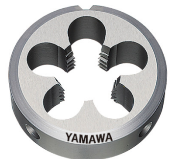
斜行管用固定式圓板牙：D