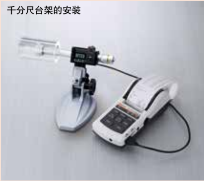
千分尺台架的安装